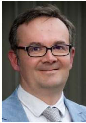
M. Samuel LAINÉ

Magistrat issu de la promotion 1995, il a été nommé en 1997 substitut à Lille, juge d’instruction à Douai en 2000 puis substitut à Pointe à Pitre en 2002. Il sera ensuite nommé à l’administration centrale du ministère de la justice en 2004. De retour en juridiction, il fut successivement premier vice-président à Quimper en 2010, vice-président chargé du tribunal d’instance de Bordeaux en 2015 puis mis à disposition auprès de l’administration centrale du ministère de la justice Cabinet du Garde des Sceaux (Conseiller services judiciaires et réformes statutaires) en 2016. Il fut ensuite nommé premier vice-président adjoint à Bordeaux en 2017 avant d’être détaché auprès de l’Ecole nationale de la magistrature, le 1 er décembre 2020, dans les fonctions de directeur adjoint chargé des recrutements, de la formation initiale et de la recherche.